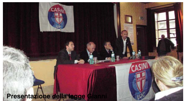
Presentazione della legge Gianni