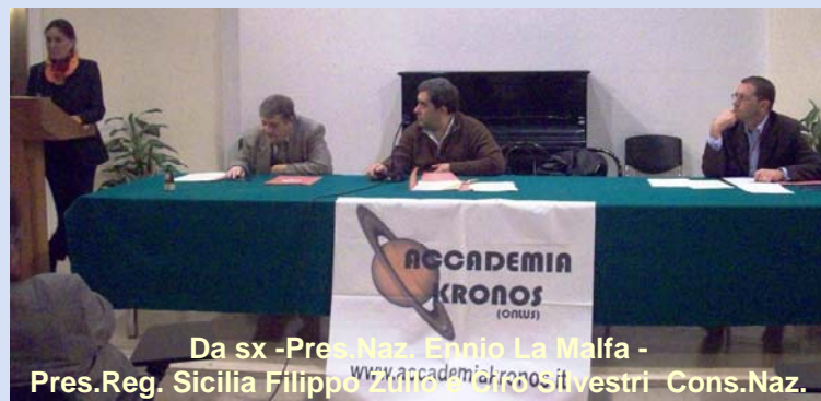
Da sx - Pres. Naz. Egonio La Malfa - Pres. Reg. Sicilia Filippo Zito e Circo. Silvestri Cons. Naz.

Siracusa - Dalla sede provinciale siracusana dell'associazione ambientalista "Accademia Kronos" parte l'invito per una campagna elettorale più pulita, quindi, all'insegna del rispetto dell'ambiente. L'invito ovviamente è rivolto sia ai partiti sia ai candidati presenti nelle liste elettorali della campagna per il rinnovo del Parlamento Europeo o nelle liste impegnate nel rinnovo degli organismi di enti locali. La richiesta d'impegno socio-ambientale prende lo spunto dalle tante occasioni elettorali che hanno mostrato il peggio di coloro che vogliono essere classe dirigente a capo di istituzioni. Accademia Kronos chiede