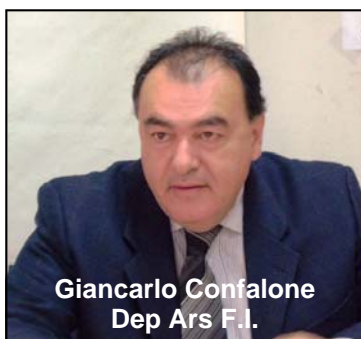
Giancarlo Confalone Dep Ars F.I.

Siracusa - All'onorevole Giancarlo Confalone non piace la istituzione del Parco degli Iblei istituito e finanziato recentemente dal DPE con 250.000 euro per la sua perimetrazione. In pratica la istituzione del Parco degli Iblei sarebbe