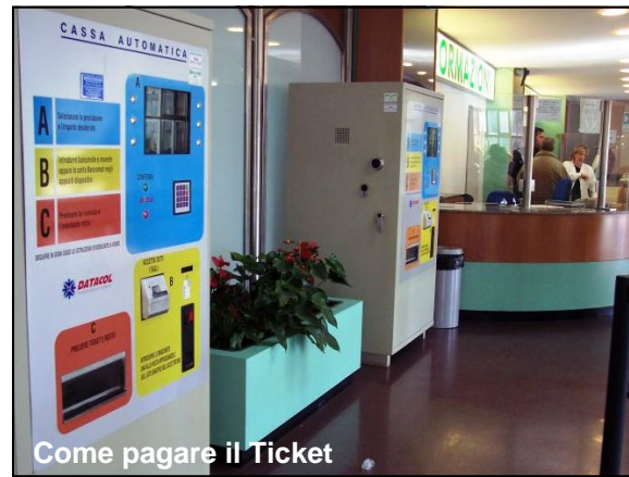
Come pagare il Ticket