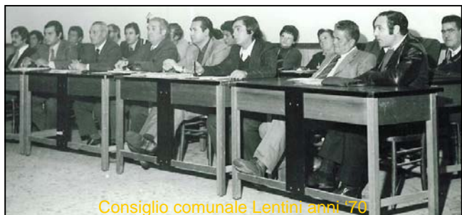
Consiglio comunale Lentini anni '70